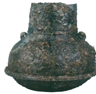
鉄製釜(SKT39地点) 堺市文化財課保管