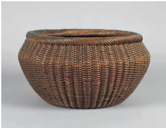
達磨炭斗 六閑斎好 飛来一閑作 今日庵蔵