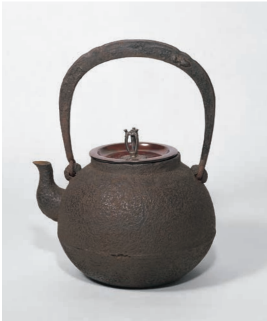
常盤形鉄瓶 無限斎好 大西浄中作 今日庵蔵