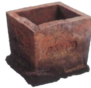
炉壇(SKT230地点) 堺市文化財課保管