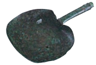
銅製灰匙(SKT411地点) 堺市文化財課保管