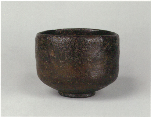
黒染茶碗 銘シコロヒキ 長次郎作 今日庵蔵