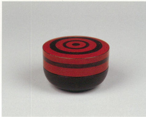
独染棗 裏千家九代不見齋好・直書 今日庵蔵